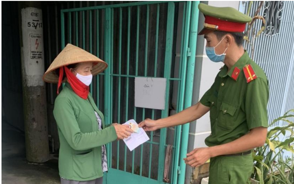
Cảnh sát khu vực trao thẻ CCCD cho người dân ở phường Trà An.

Ngày 30-9-2021, Công an quận Bình Thủy tổ chức trả thẻ căn cước công dân (CCCD) có gắn chip điện tử đến tận nhà cho người dân trên địa bàn quận, nhằm hạn chế tình trạng tập trung đông người.