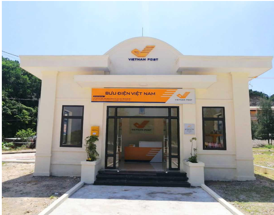
Trụ sở điểm Bưu điện văn hóa đảo Trần

Ngày 1/10, tại đảo Trần, huyện Cô Tô đã khai trương điểm bưu điện văn hóa. Việc thành lập điểm Bưu điện - Văn hoá tại đảo Trần là một trong những niềm tự hào, đánh dấu sự đóng góp của ngành Bưu điện trong sự nghiệp bảo vệ và xây dựng Tổ quốc.