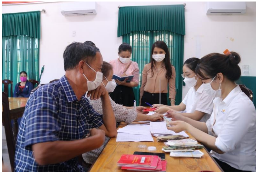
Đại diện lãnh đạo Sở LĐ-TB&XH tỉnh Thừa Thiên Huế trực tiếp kiểm tra công tác chi trả trong ngày đầu áp dụng hình thức mới

Để kịp thời nắm bắt tư tưởng, ý kiến kiến nghị của người dân, đồng thời chấn chỉnh một số yếu tố kỹ thuật nhỏ, ngay ngày đầu thực hiện chi trả chính sách ưu đãi người có công với cách mạng qua hệ thống bưu điện, đại diện lãnh đạo Sở LĐ-TB&XH tỉnh Thừa Thiên Huế đã trực tiếp đến các địa điểm chi trả để kiểm tra, ghi nhận. Một số rất ít trường hợp nhận thay nhưng chưa bảo đảm về mặt thủ tục pháp lý đã được phát hiện và yêu cầu tạm dừng chi trả. Bên cạnh việc giải thích để người dân hiểu và thông cảm, đại diện Sở cũng đề nghị phía bưu điện đến tại nhà đối tượng để xác nhận lại và thực hiện chi trả trong thời gian sớm nhất; đồng thời đề nghị đối với các trường hợp đau ốm, tuổi cao không đi lại được, có thể đăng ký chi trả tại nhà để nhân viên bưu điện thực hiện chi trả những lần tiếp theo.