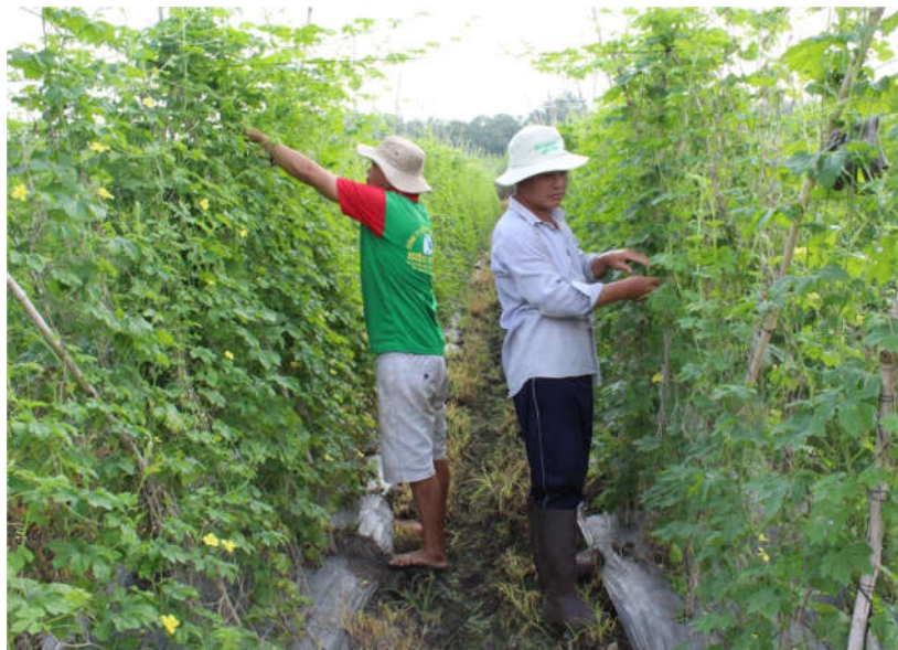
Nông dân chăm sóc khổ qua (ảnh chụp trước ngày 27.4.2021).

Tạo điều kiện thuận lợi cho sản xuất nông nghiệp phát triển. Những tháng đầu năm 2021, mặc dù bị ảnh hưởng dịch bệnh Covid-19, một số loại nông sản gặp nhiều khó khăn trong tiêu thụ, nhưng doanh nghiệp trên địa bàn tỉnh đã triển khai nhiều giải pháp, tích cực tìm hướng đi mới trong sản xuất theo yêu cầu của thị trường, tạo lợi cho sản xuất nông nghiệp phát triển.